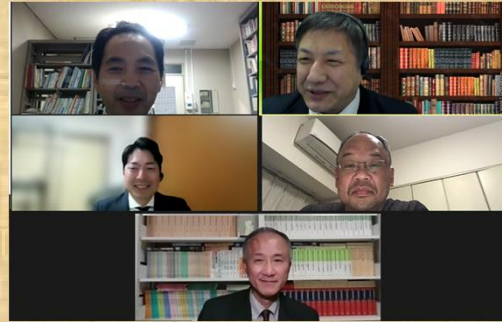
オンラインを積極的に活用します(フレックス)