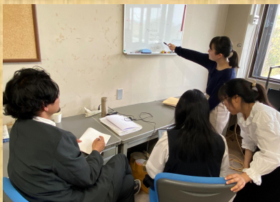
実践知と経験値が高まります(課題研究と実習)