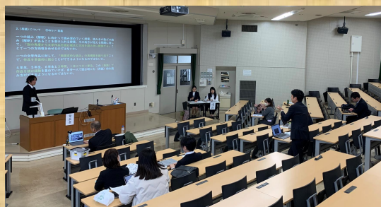
研究成果を学会で発表(言語表現学会)